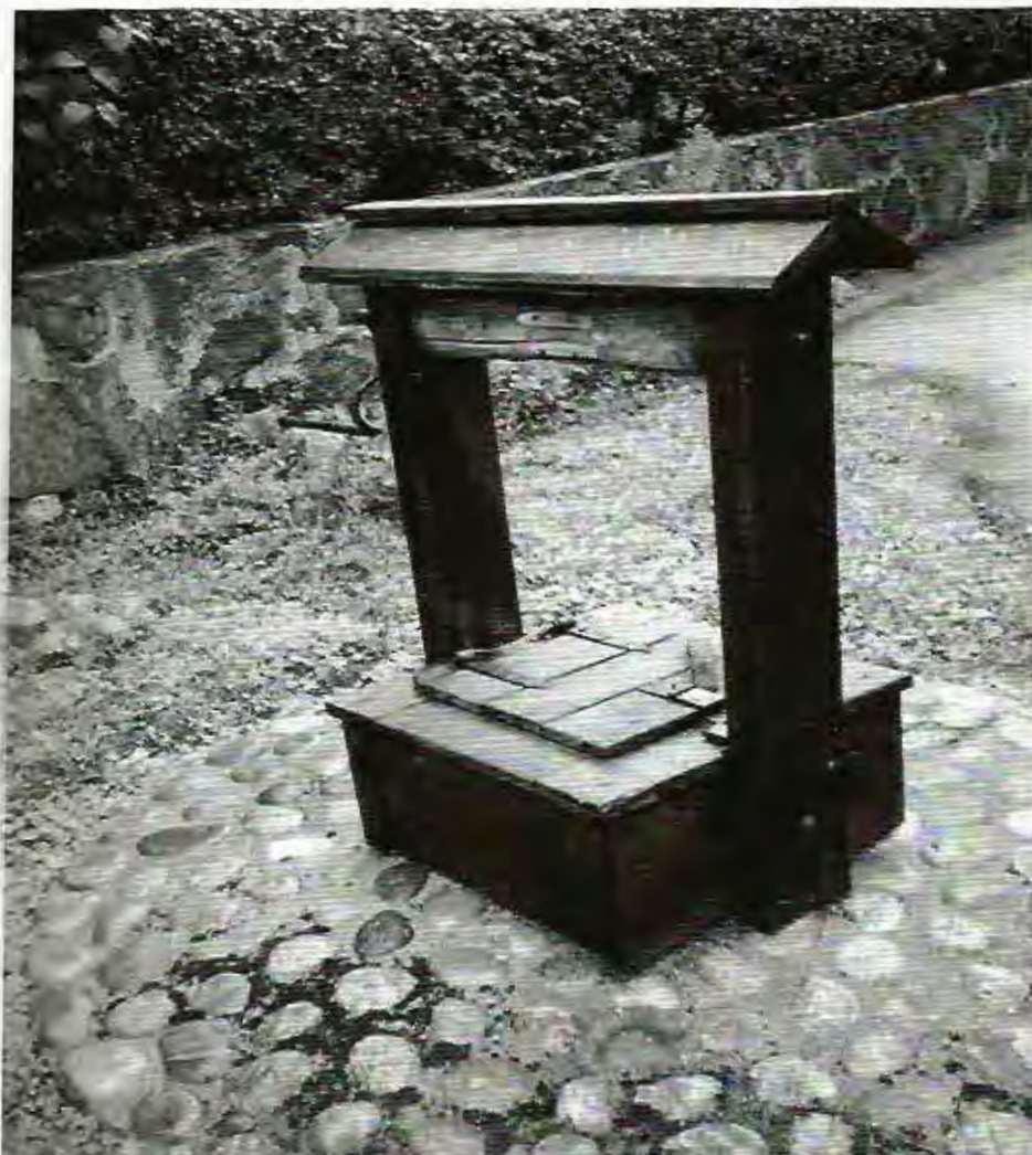
Kvartersbrunnen på Torviggsgränd (Före kranavannets införande 1953)