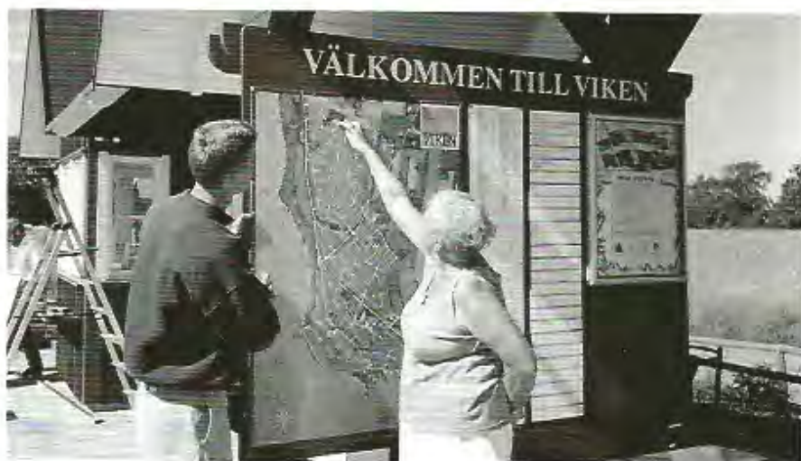
Fotot föreställer "informationshuset" vid södra infarten till Viken. En av kommunen projektanställd ung man (t v) visade turisterna till rätta i Viken såväl som Kullabygden.

Stöd Vikens Byaförening genom medlemskap: 100 kr per år och familj insättes på föreningens postgiro 68 79 01-9