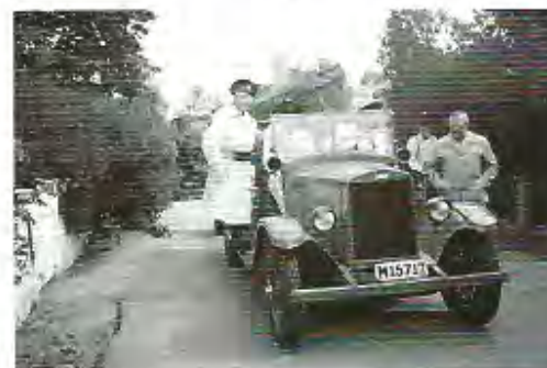
"Gamla Lotta" visar upp sig

Brandövningarna skedde regelbundet men bränderna i byn inträffade oregelbundet med månader då inget hände för att sedan avlösas av en vecka med flera stora som små bränder. Men den frivilliga brandkåren var billig i drift. Vikens kommun delvis stödd av brandförsäkringsbolagen finansierade fordon och material, medan brandmännen övade och praktiserade släckning praktiskt taget ideellt. Ändå var frivilligkåren snabb och effektiv samt inte minst viktigt fanns på plats i rätt tid när elden kom lös i byn.