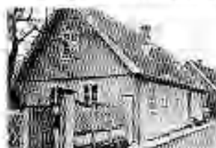
Den Jöniska Gården