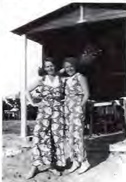
Moster Vera i h vid caféet

Luftmadrassen var ännu ej uppfunnen. Till plåtshyran 1 kr per natt hörde att tältplatsen skulle städas efteråt. Många smet från sitt skräp och då fick vi själva räfsa ihop halmen. Hela familjen hjälptes åt. Skräpet samlades vid stranden för att eldas upp vid lämplig väderlek. Till helgerna bakades två sorters småbröd, vetebröd och sockerkaka. Det var på den tiden man skilde på gulor och vitor, som vispades för sig. Det var mitt jobb. Elvisp fanns inte. Vi hade förresten varken elektriskt ljus eller telefon. Det gick bra med fotogenlampor.