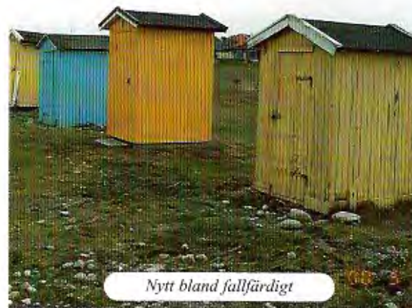
Nytt bland fallfärdigt