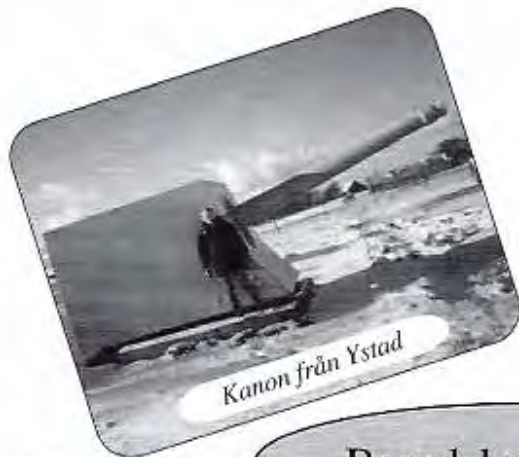
Kanon från Ystad