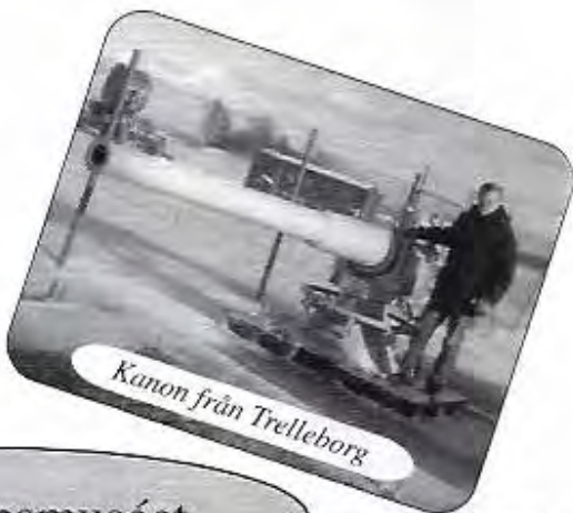
Kanon från Trelleborg