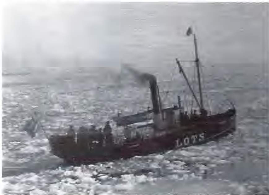
Lotsbåten i Viken