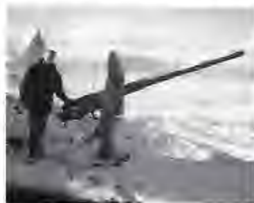
Kanon från Vikens hamn