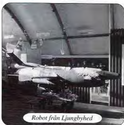
Robot från Ljungbyhed