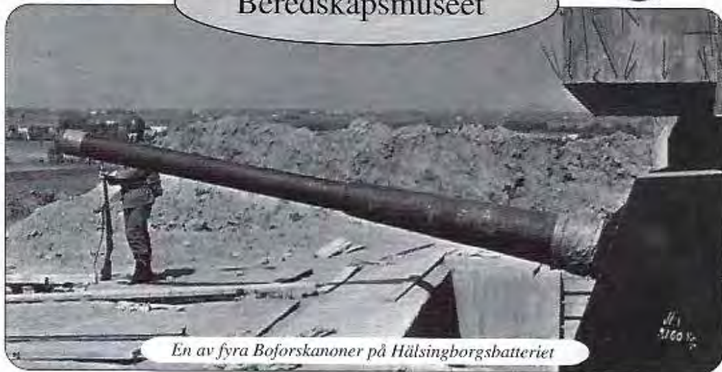
En av fyra Boforskanoner på Hälsingborgsbatteriet