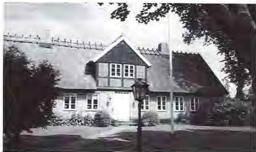
Skeppargård - sommarnöje - prästgård

Kan man tala om en byggnads själ? Om den finns - sitter den i så fall i exteriören eller i det inre eller är det helheten som räknas? Är det så att byggnadens själ har något att göra med de människor som har bott i huset? Har de skänkt huset dess själ? Jag skulle föredra det senare. Men kanske det räcker med att tala om byggnadens egen historia; en historia som skänker byggnaden ett innehåll, som kan vara värt att berätta. En sådan berättelse följer här och den handlar om Vikens prästgård speglad i byns historia.