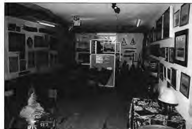
Interiörbild från Vikens Sjöfartsmuseum