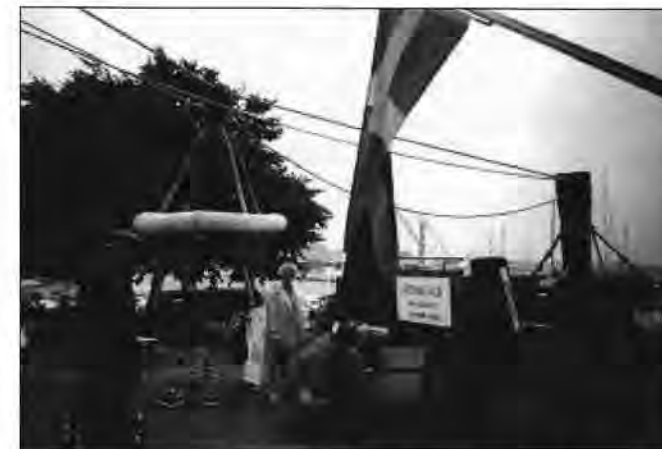
Räddningsvagn till höger och en räddningskorg till vänster vid visningen i Vikens hamn

Muséet anordnar specialutställningar såsom Sjöräddning förr -94 och Lotsar i Viken -95 i samband med Viken-Weekend.