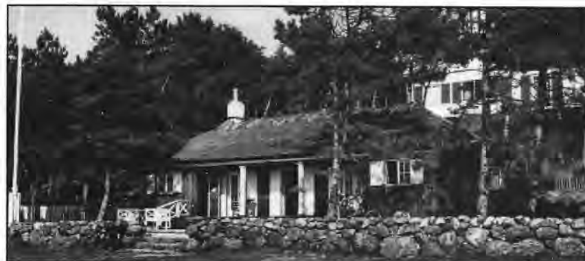
När klubbhuset i Viken hade halmtak